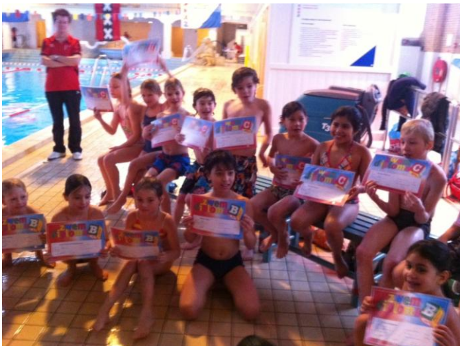
De hele groep met hun nieuwe diploma (helaas staat Damy net niet op de foto)

Een poosje geleden heeft u kunnen lezen dat er vijf kinderen een diploma hadden gehaald bij het schoolzwemmen. Vorige week donderdag was de laatste les in het Zuiderbad voor groep 5B. Het komende half jaar zal groep 5A gaan zwemmen. De laatste les is traditioneel weer een afzwemles. En hoewel het de bedoeling van schoolzwemmen is dat zoveel mogelijk kinderen hun A-diploma halen heeft de Notenkraker een geweldig resultaat behaald. Om met de woorden van de zwemmeester te spreken: "We hebben nog nooit zo'n goede C-groep gehad". Maar liefst negen kinderen hebben hun C diploma gehaald en vijf kinderen hebben hun B gehaald. Het is bijzonder om te vermelden dat er vijf leerlingen zijn die in de afgelopen periode twee diploma's hebben gehaald! Bravo groep 5.