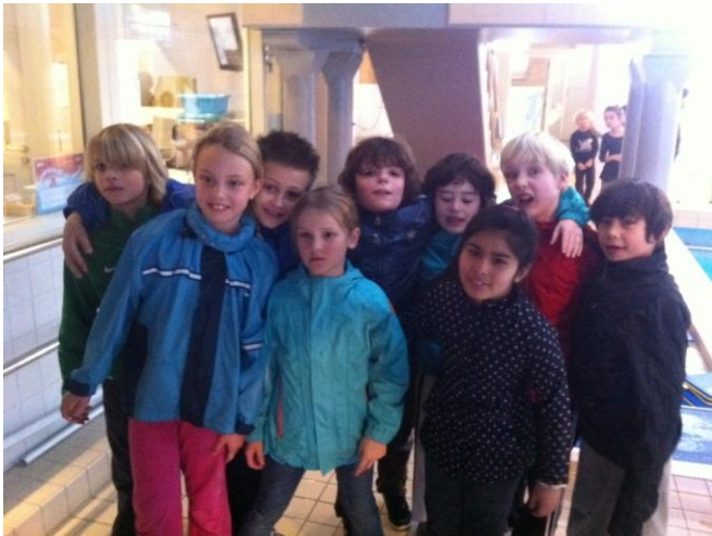
De C groep nog met kleren aan vlak voor de grote plons

Een poosje geleden heeft u kunnen lezen dat er vijf kinderen een diploma hadden gehaald bij het schoolzwemmen. Vorige week donderdag was de laatste les in het Zuiderbad voor groep 5B. Het komende half jaar zal groep 5A gaan zwemmen. De laatste les is traditioneel weer een afzwemles. En hoewel het de bedoeling van schoolzwemmen is dat zoveel mogelijk kinderen hun A-diploma halen heeft de Notenkraker een geweldig resultaat behaald. Om met de woorden van de zwemmeester te spreken: "We hebben nog nooit zo'n goede C-groep gehad". Maar liefst negen kinderen hebben hun C diploma gehaald en vijf kinderen hebben hun B gehaald. Het is bijzonder om te vermelden dat er vijf leerlingen zijn die in de afgelopen periode twee diploma's hebben gehaald! Bravo groep 5.