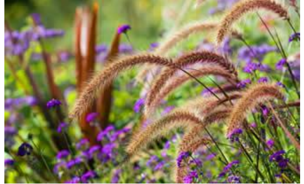
Ondertussen, in de natuur...