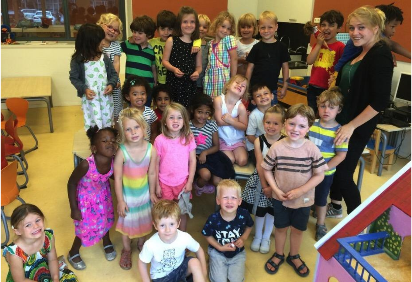
Fijne zomervakantie allemaal!